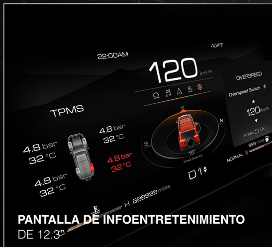
PANTALLA DE INFOENTRETENIMIENTO DE 12.3"